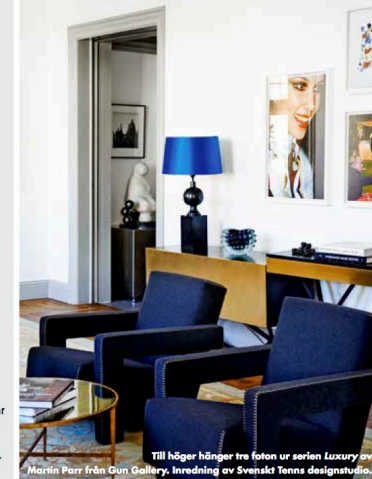
Till höger hänger tre foton ur serien Luxury av Martin Parr från Gun Gallery. Inredning av Svenskt Tenns designstudio.