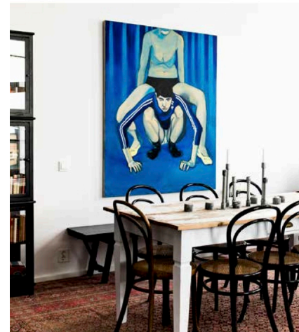
Rida 4 av Sara-Vide Ericson i en inredning för Oscar Properties.

Samlare går ut på att ”aktivera” de konstlager som finns hos gallerister, samlare och konstnärer: att göra konst som annars är gömd i lager tillgänglig och synlig. Genom sina kontakter har Moderna Samlare tillgång till ca 800 verk av väletablerade konstnärer.